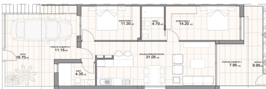
Apartamento 1. TIPO A Apartment 1. TYPE A